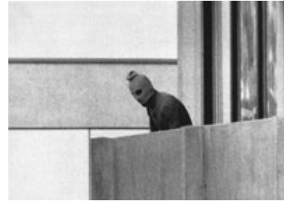
阿拉伯突击队组织 1972 年在德国慕尼黑夏季奥运会期间杀害以色列运动员。图为该组织一名成员站在以色列人质被扣押的奥运村建筑物的阳台上。

最后一点需要指出的是，崇尚暴力的恐怖主义组织的一些网站充斥着非暴力的说辞——如声称“热爱和平”和表示支持外交解决方案。这种将图像和论辩共同使用的手法是要影响所有受众。