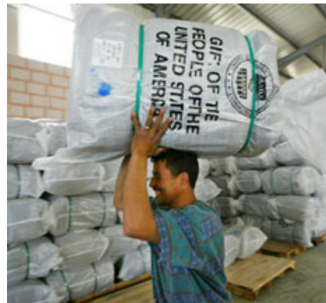
工人们在约旦首都安曼郊区的一个仓库堆放美国国际开发署(USAID)捐赠的准准备在伊拉克分发的毯子。

这不是在批评国防部——武装力量属劳动力密集和资本密集型机构。但是考虑到发展、外交和信息在这种形式的冲突中的重要性(美国新闻总署(U.S. Information Agency)于 1999 年被撤销，这里提供的国务院的人数包括后来取代该机构的国际信息局)，军事和非军事部门的能力存在明显的不平衡。这扭曲了政策，按国际标准也异乎寻常。例如，澳大利亚的军队比它的外交和援助机构的综合规模大将近 9 倍：其军队比国家力量的其他部门大，但是没有大到 210 倍。