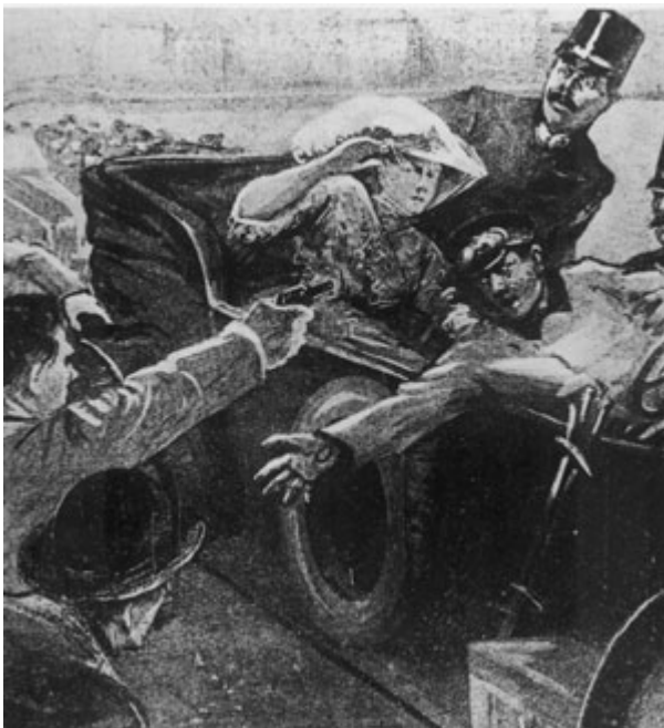
奥地利弗兰茨·斐迪南大公和夫人在 1914 年 6 月 28 日巡视波斯尼亚萨拉热窝时，被泛斯拉夫民族主义组织刺杀，从而引发第一次世界大战。

19 世纪的恐怖主义暴力活动甚为显著——被恐怖分子杀害的人有：俄国沙皇亚力山大二世 (Alexander II) 和很多大臣、大公、将军；美国总统威廉·麦金利 (William McKinley, 1901 年) 和在他之前的詹姆斯·加菲尔德 (James Garfield, 1881 年)；意大利国王翁贝托 (King Umberto)、奥匈帝国的一位皇后；法国总统萨迪·卡诺 (Sadi Carnot)；西班牙首相安东尼奥·卡诺瓦斯 (Antonio Canovas)——这些不过是遭到暗杀的最著名人士中的一些例子。不消说，一次世界大战是因奥地利王位继承人费迪南 (Franz Ferdinand) 1914 年在萨拉热窝被刺杀而引发的。