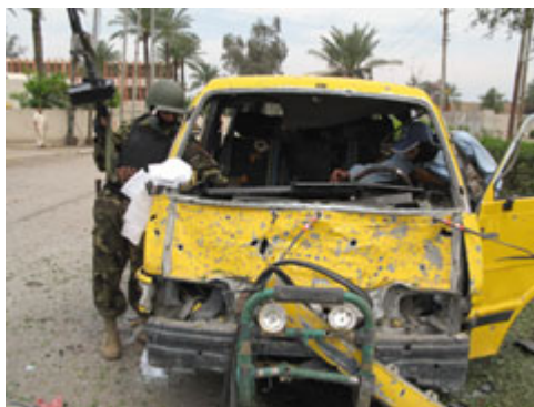
2007 年 4 月，伊拉克士兵检查一辆在伊拉克巴古拜发生的袭击中被击毁的汽车。自杀爆炸手炸死一名 12 岁男孩，炸伤九名平民。

自 2003 年以来，伊拉克的自杀性爆炸事件超过了哈马斯在以色列、真主党在黎巴嫩和泰米尔猛虎组织在斯里兰卡策动的自杀性爆炸事件的总和。这些爆炸事件绝大部分是以伊拉克安全部队和什叶派平民为目标，而不是攻击联盟军队。这些自杀爆炸手中的很多人——可能是大多数人——是非伊拉克籍的志愿人员，多数人与在 1990 年代在阿富汗接受培训的“第二代”圣战者建立的圣战网络有联系。这些激进分子在自己的祖国或寄居国家被通缉，那些应招的新人则是因为看到伊拉克穆斯林遭受苦难而感到愤怒。