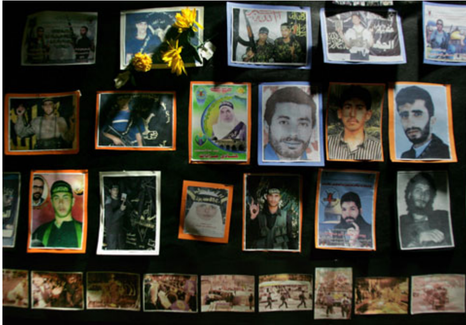
在位于约旦河西岸拉马拉(Ramallah)市郊的比尔泽特大学(Birzeit University)的一个展览上，一座墙上悬挂着巴勒斯坦自杀爆炸手的肖像，下方是以色列受害者和被炸毁的公共汽车的照片。一些巴勒斯坦儿童收集爆炸手的照片。

这不是自杀。自杀是软弱，是自私，是有精神问题。这是起义 [殉教或以安拉的名义献身。]