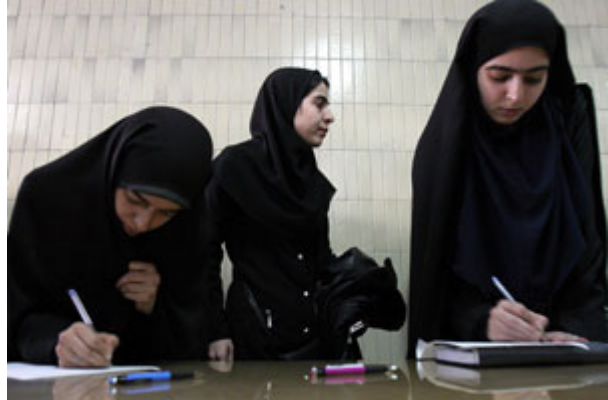
2006 年 2 月，伊朗女学生在填写登记表，表明她们愿意执行自杀性袭击任务。

但是，多年的研究发现，在恐怖分子中出现的精神变态和人格障碍并不比在同一个社区的非恐怖分子中更常见。虽然我们不再认为是男人迫使大多数妇女从事恐怖主义，但是这些妇女生活中的男子在动员她们诉诸恐怖主义当中起到了重要作用。据高尔文 (Deborah Galvin) 说，“有些妇女是被她们的男朋友招募进入恐怖组织的。女性参加恐怖活动的一个显著特征可能是，男性或女性情人/同谋 .....的情形。” 2 事实上，虽然里沙维在阿曼婚礼上谋杀未遂，但陪同她去的丈夫得逞，杀死了 38 人。