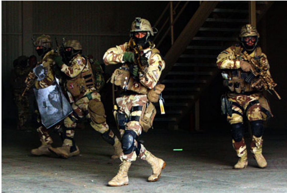
伊拉克特别行动部队在毕业典礼上演示他们打击恐怖分子的能力。美国伊拉克联盟军队指挥官戴维·彼得雷乌斯将军(David H. Petraeus)和伊拉克总理马利基(Nuri al-Maliki)出席了仪式。

伊拉克圣战者面临一场困难的宣传战。他们传播的信息必须实现五项目标：吸引伊拉克境内外可能的招募对象；为杀害平民和穆斯林同胞的暴乱袭击行动寻找借口；解除可能阻止其同夥用自杀袭击方式杀害平民的自我抑制规范；使暴力组织合法化；反驳伊拉克和穆斯林世界各国政府的说法。