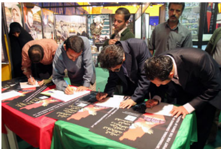
伊朗男子2006年4月在德黑兰举行的招募集会上登记，表示愿意充当自杀性“烈士”。

2005年7月7日在以伦敦地铁系统为目标的四起有联系的自杀爆炸事件发生后不到一年，人们等待已久的一份下院调查报告得出结论说：“基于我们迄今为止对英国极端分子的了解，没有一组共同的特徵能够帮助我们鉴别哪些人可能受极端主义影响。涉及本案的四个人中，三人是其父母都来自巴基斯坦的第二代英国公民，另外一人的父母来自牙买加；被判犯有投放蓖麻毒罪的卡迈勒·布贾斯(Kamel Bourgass)是寻求避难未果的阿尔及利亚人；在鞋内藏带炸弹作案未遂的理查德·里德(Richard Reid)的母亲是英国人，父亲是牙买加人。……有的受过良好教育，有的受教育程度不高。有的是真正贫困，有的并非如此。有的显然很好地融入了英国社会，有的则不然。他们大多是单身，但有的是有孩子的已婚男子。有的过去一直遵纪守法，另一些人则有轻微犯罪的记录。” 1