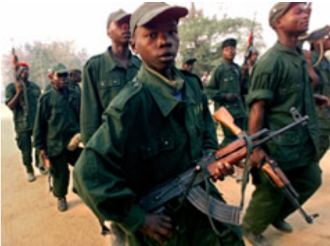
刚果反叛运动组织的儿童兵。全世界有几十万不满 18 岁的少年扛枪打仗。

在穆斯林世界出现“圣战”(jihad)的提法之前数十年，儿童兵的招募是在非洲和南美进行的。儿童在那些战争中表现得勇敢无畏。毕竟，一次又一次的研究表明，年轻人冲动，喜欢冒险。而且他们尚未成熟，难以正确地判断自己处理问题或认识潜在危险的能力。