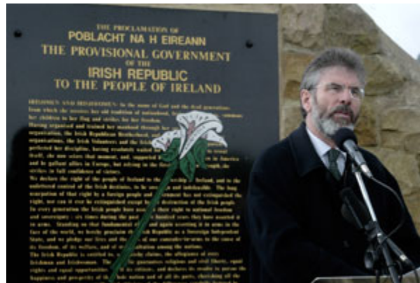
2006年4月，(北爱尔兰)新芬党(Sinn Fein)主席格里·亚当斯(Gerry Adams)在反英国活动90周年的纪念仪式上讲话。

这些恐怖分子为献身其事业而采取极端行动的理由是什么呢？这里有一个特别能说明问题的答案。