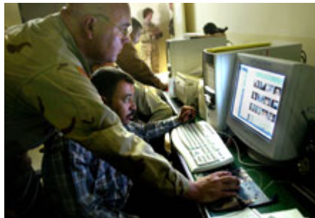
美国国民警卫队队员在巴格达西部的重大案件刑侦队办公室与伊拉克警察一起工作。

目前，我军已有一套完整的信息战原则，但其他机构还没有，而他们对军队采用的方法往往持谨慎态度，这不无道理。信息行动的军事化会造成严重错误，即把部份(军事行动)误作整体(美国国家战略)，从而危害到我们的整体政策。缺乏适用于整个政府的原则和缺乏展开战略信息战的能力会限制我们的有效性并造成信息不一致——即美国政府各部门发出不同的信息或依照不同的信息日程展开工作。