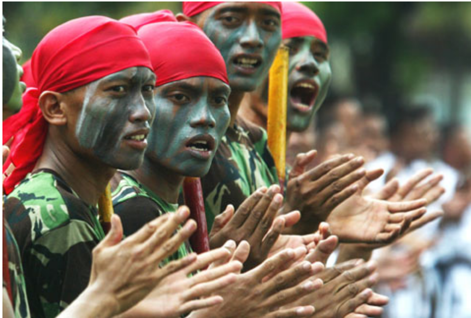
2006 年在雅加达市外举行的一次反恐演习期间印度尼西亚政府军突击队为战友喝彩。包括印尼部队在内的许多国家的军队参加了国际反恐之战。

形容词很关键：特种部队相对于战略服务。特种部队具有特殊性。对它的定义是基于与军队其他部门的内部比较。特种部队执行的任务超出了普通部队的能力。相比之下，战略服务局具有战略性。它是相对于外部环境加以定义的，其执行的任务具有重要的战略意义，在必要时能够迅速增加和减少能力。特种部队人员几乎全是军人；而战略部队则是一个有着大批文职人员的跨机构队伍，其几乎所有的军事人员都是在战时紧急情况下征募的(具有与战略相关的技术、才华出众的文职人员。 13 特种部队起源于战略服务局，但是，今天的特种部队是具有高度专项能力的精锐部队，经过优化改组专门执行七类标准任务， 14 战略服务局则是文职人员和军人混合的组织，其执行的任务依环境要求而定，随时基于需要进行能力建设。