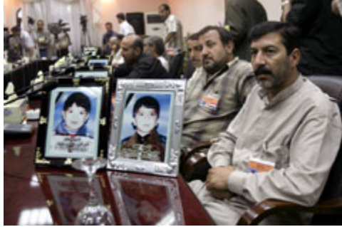
在巴格达什叶派穆斯林居住区的一次汽车炸弹袭击中丧生的 18 名儿童的家人 2005 年 7 月在与伊拉克政府官员进行的一次纪念餐会上。桌上是他们孩子的画像。