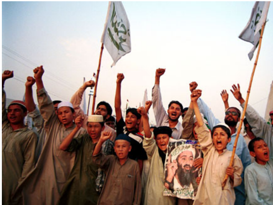
巴基斯坦一个宗教学校的阿富汗学生 2001 年在巴基斯坦卡拉奇参加集会。

莱拉(Laila)也是10岁，她多次表示不想嫁人，而要上学，但她的父亲温和地告诫她，说将很快把她嫁出去，因为她长大后需要有个男人保护她。的确，在难民营里女孩们玩的一个主要游戏就是举办“婚礼”。