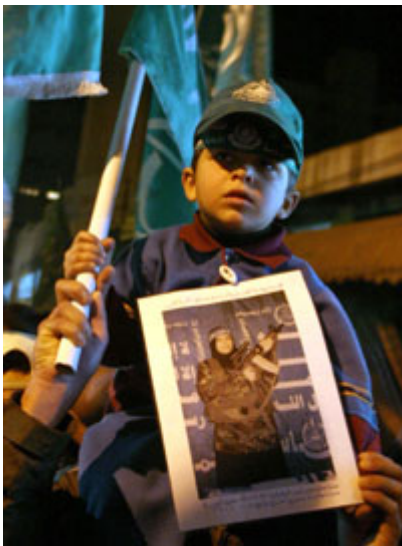
在 2004 年支持哈马斯的一次集会上,一名巴勒斯坦男孩手持一幅一名在以色列和加沙地带之间一个主要交界点引爆炸弹的妇女的照片。有四人在爆炸中丧生。