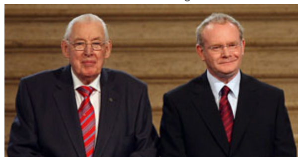
一年后，2007年5月8日，北爱尔兰首席部长伊恩·佩斯利(Ian Paisley，左)与首席副部长、新芬党的马丁·麦吉尼斯(Martin McGuinness)在贝尔法斯特(Belfast)斯托蒙特议会大厦宣誓就职，主持北爱尔兰议会权力共享工作。

武装行动宣称：我在这里，我存在着，我坚强有力，我掌握着控制权，我依然在行动，我在地图上。