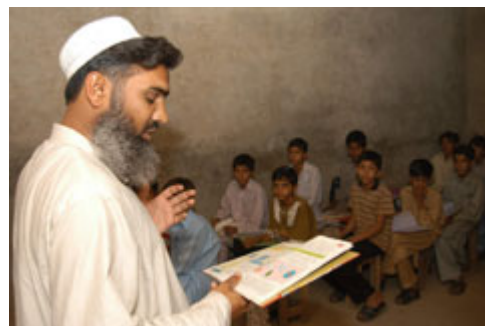
与“基地”组织有联系的巴基斯坦学校的教

正如我在上文所指出的那样，成年男子很多人已经离开家，本来就已经被剥夺了上学机会的妇女及其女儿们不得在外面做工。如果让男孩子们在学校、食品、衣服或者在垃圾堆里寻找食物之间进行选择的话……但有时根本就没有选择可言。