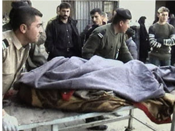
2004 年 2 月，被自杀爆炸炸死的受害者被抬往伊拉克北部一家医院。至少有 57 人在那次袭击中被炸死，另有 250 人被炸伤。

有关在冷酷而又傲慢的强权手中遭受屈辱的主题是这些宣传的核心内容。集体受辱的图像经常以 2003 年伊拉克战争初始阶段的镜头开始，描绘力量对比的悬殊，展示清真寺遭到毁坏、受害者身上流着鲜血和被抄家等诉诸情感的照片。所有这一切，特别是来自阿布哈里卜监狱(Abu Ghraib)的图像，使人们能够具体感受到屈辱感，加剧了很多穆斯林的无力感和愤怒。