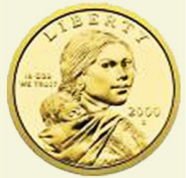
有莎卡嘉薇亚头像的一美元镀金硬币，第一批硬币于 2000 年铸造

波卡洪塔斯(Pocahontas) 和 莎卡嘉薇亚(Sacagawea) — 在上述努力中发挥了重要作用。