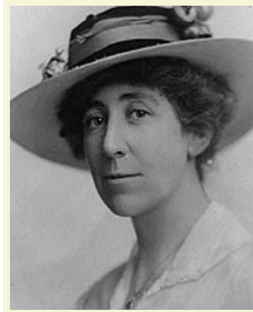
珍妮特·兰金。

长期以来，妇女扮演妻子、母亲和家庭护理者等一度被认为是天经地义的角色。但在上述年代里，妇女在这些领域之外取得了突破性进展。许多女子上大学念书，当男人在二次世界大战中驰骋疆场时担当起工厂工作的重任。1920 年，妇女赢得了选举权，这项胜利鼓舞她们在政治和政府舞台上又取得无数其他成就。