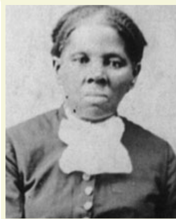
哈丽雅特·塔布曼 (国会图书馆图片科)

19 世纪中叶的美国处于一种自相矛盾的状态：她既是一个热爱自由的国家，又是一个 保留着奴隶的社会 。在东部沿海地带的某些地方，奴隶制已持续了 200 多年，并是南方经济固有的组成部份。但随着时间的推移，呼声越来越高的废奴运动提请人们关注美国的理想和南部的奴隶制之间的巨大鸿沟。形势日益紧张，1861 年，终于爆发了 南北战争 。美国北方地区在亚伯拉罕·林肯(Abraham Lincoln)总统的领导下，经过 4 年浴血奋战，取得了最后的胜利，导致了奴隶制在美国的废止。