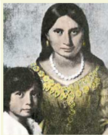
波卡洪塔斯

美洲殖民地的生存以及后来美国的建立并非必然 — 事实远非如此。17 世纪 早期的移民 — 即使是在繁荣发展的定居点 — 必定要忍受艰苦的生活条件、食品的匮乏、疾病和辛苦劳作。弗吉尼亚州罗阿诺克(Roanoke)这块“失落的殖民地”充份反映了他们面临的困难处境。两个世纪以后，即在 19 世纪，美国人开始向西跋涉，跨越密西西比河，放弃已建立起来的城镇中相对舒适的生活，去开辟新的领地和开垦太平洋沿岸地区。殖民地的生存以及开发西部领地的能力对于美国的建立和发展至关重要。两位年轻的印第安女性 —