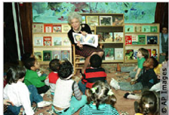
第一夫人芭芭拉·布什1990年在纽约带领学龄前儿童读书。

埃莉诺·罗斯福的丈夫,富兰克林·罗斯福(Franklin Roosevelt)因患小儿麻痹症而丧失了行走能力,因此难以到全国各地视察。罗斯福夫人代替他从事这项重要工作——用她的话说,充当丈夫的“眼睛和耳朵”。除履行第一夫人的职责外,埃莉诺·罗斯福还为一份月刊和一家日报撰写专栏文章,发表演讲,主持一个每周一次的广播节目,并著有数本著作。她是一位在世界舞台上具有影响力的国际人物。