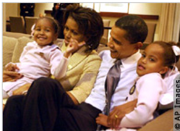
2004年奥巴马与夫人米歇尔及女儿马莉娅(右)和萨夏轻松愉快地在一起。

如果奥巴马在2008年11月赢得总统大选，奥巴马一家将成为入主白宫的第一个非洲裔美国人家庭。