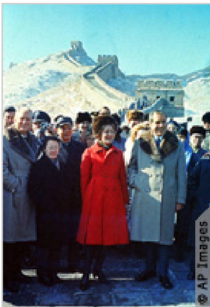
尼克松总统1972年登上长城，标志着美国同中国外交关系解冻。

— 总统有权缔结条约，但须争求到“出席的参议员中”三分之二人的“意见和同意”；有权任命大使和最高法院法官，但须得到参议院多数成员的确认；有权任命其他所有“公使”以及“合众国官员”；