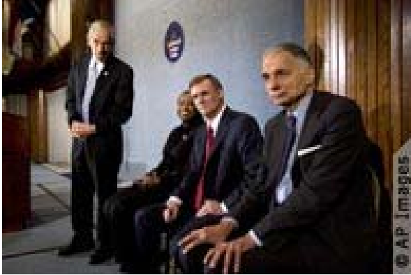
保罗、麦金尼、鲍德温和纳德要求新闻媒体对第三党候选人给与更多报道。

共和党和民主党长期以来一直主宰着美国的政治场景。自 1856 年以来，由美国选民选出的历届总统不是共和党人，就是民主党人。但美国还有 30 多个其他政党，统称为“第三党”。而且，不属于任何党派的无党派人士也可以参加竞选。