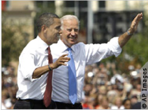
奥巴马和拜登 2008 年 8 月在伊利诺伊州的斯普林菲尔德向群众挥手致意。

拜登在担任联邦参议员之初，侧重于国内事务，特别是在公民自由、执法和民权领域。拜登于 1975 年成为参议院司法委员会 (Judiciary Committee) 成员，并于 1987 年到 1995 年担任司法委员会主席。拜登在这个时期最突出的立法成就是他起草的具有里程碑意义的《防止对妇女施暴法》(1994 年)。这项立法为打击性别歧视犯罪提供数十亿美元的联邦资金。不过，拜登有时会偏离传统的自由主义路线。例如，他曾坚决要求以更严厉的判刑法规来惩治贩毒。他也曾在坚持保护民权的同时，反对用校车运送学生的方式实现学校种族融合。