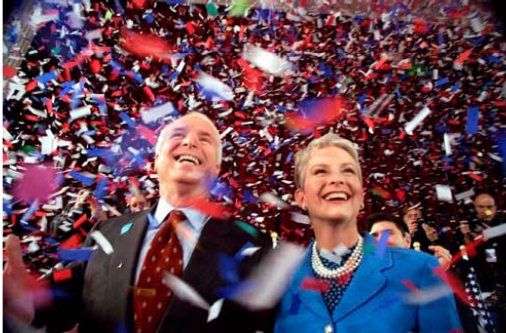
在 2000 年总统竞选中，麦凯恩夫妇在新罕布什尔州的一次市民会议上沉浸在欢庆气氛中。