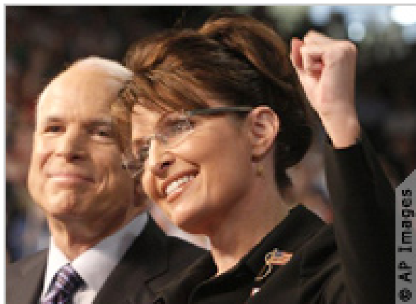
阿拉斯加州长佩林同麦凯恩参议员在俄亥俄州一道竞。